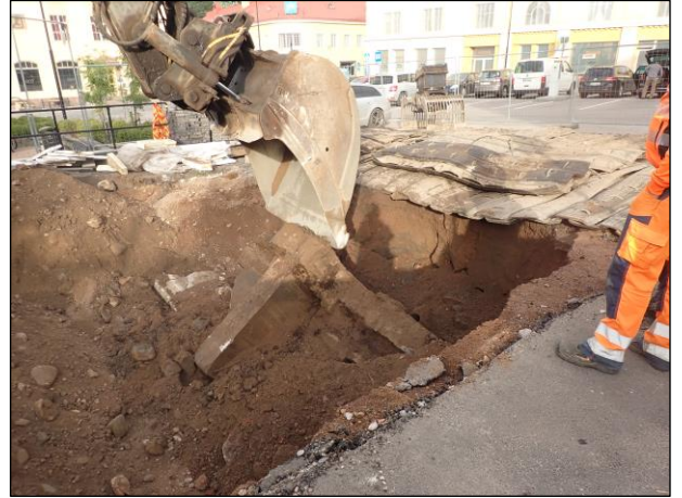
Vasemmalla: Sokkelin pohjoissivu ennen poistoaan (vas.) ja poiston jälkeen (oik.). Kaivurajan seinämässä on sorahiekkaa eli täyttömaata.