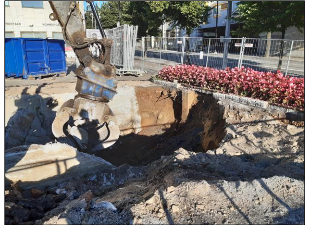
Vasemmalla: Betonisokkeli luoteeseen kuvattuna. Oikealla: Kaivun etelärajan seinämässä näkyy todennäköisesti kioskin rappusiin liittyvää betonirakennetta.