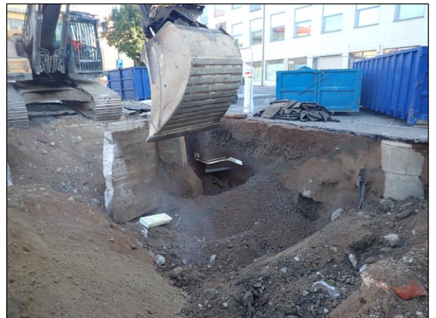
Vasemmalla: Betonisokkeliä puretaan kaivannon itäreunassa. Kuvattu koilliseen. Oikealla: Sokkelin takana, kaivurajan seinämässä, näkyy murskeita ja muovirakenteita.