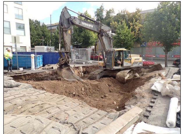
Vasemmalla: Täyttömaasta tulleita lohkareita. Oikealla: Kaivanto valvonnan päättyessä. Kaikkea kaivettua maata ei viety pois, vaan sitä liikuteltiin ja tasattiin kaivantoon. Kuvattu kaakkoon.