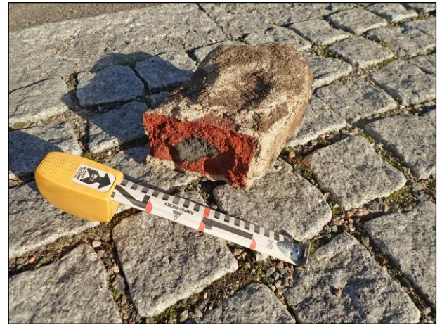
Vasemmalla: Valmiin kaivannon luoteiskulmassa on pohjaan asti täyttömaata ja keraamista putkea. Mitta 155 cm. Oikealla: Kaivannon täyttömaasta löytynyt laastinen tiili.