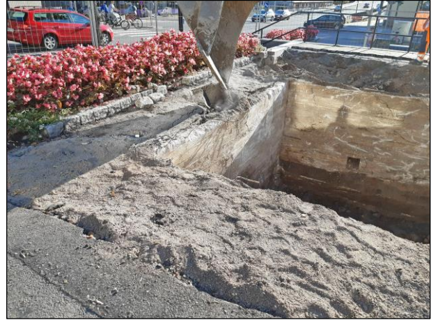
Vasemmalla: Täyttömaita kaivetaan pois betonisokkelin sisältä. Kuvattu lounaaseen. Oikealla: Betonisokkeli esille kaivettuna. Kukkapenkin reuna on kaivun eteläraja. Se sijaitsee suunnilleen samalla kohtaa, kuin kioskin entiset rappuset, joiden eteläpuolella on havaittu muinaisjäännöskerroksia vuonna 2017 (Pesonen & Koivisto 2018)