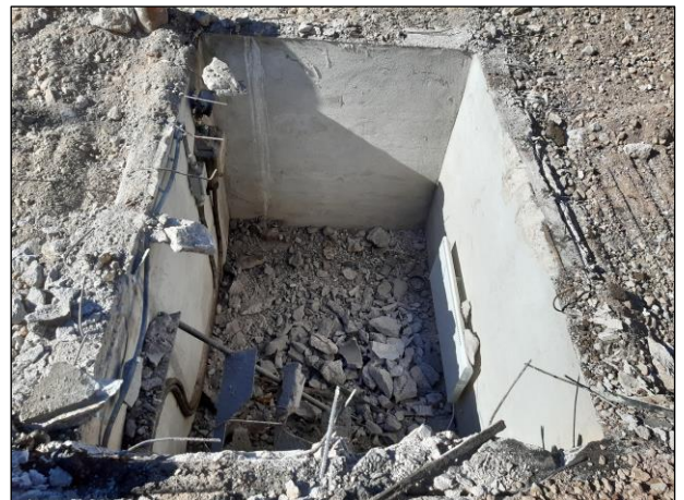
Vasemmalla: Asfaltti ja kioskin maanpäälliset osat poistettuna kaivannon alalta. Kuvattu luoteeseen. Oikealla: Edellisen kuvan keskellä näkyvä kioskin kellarirakenne.